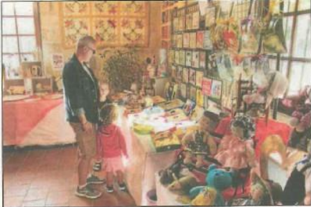
De nombreux touristes visitent l'exposition en famille