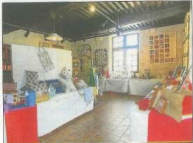
Vue d'un des métiers exposés