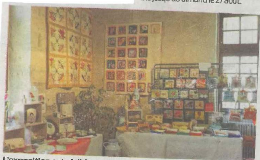
L'exposition est visible pendant une semaine encore.

Durant l'été, l'office de tourisme accueille, à la Maison du Roy, les œuvres d'artisans locaux. Entre peinture, loisirs créatifs, patchwork, broderies, poupées... chacun peut montrer son talent dans toutes les formes de l'art. L'exposition est visible jusqu'au dimanche 27 août.