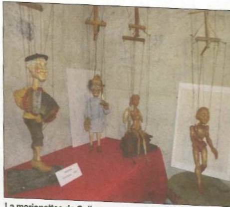
La marionettes de Colins