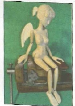
Des sculptures "l'ange"